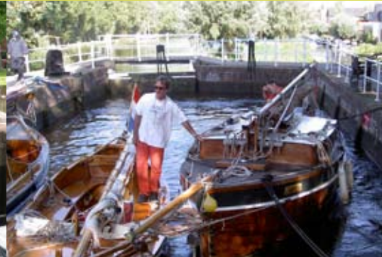
Het schutten van de schepen

Gouda heeft al eeuwenlang een bijzondere band met water. Tot op de dag van vandaag is de 'watergeschiedenis' te zien in de sluisen, bruggen en gemalen in en om de stad. Een bijzonder stukje van die geschiedenis ligt bij de Breevaart tussen Reeuwijk en Gouda. Het is een romantisch, idyllisch plekje met een bijzonder verhaal. Markant onderdeel hiervan is het Reeuwijks of Dubbel(d) Verlaat.